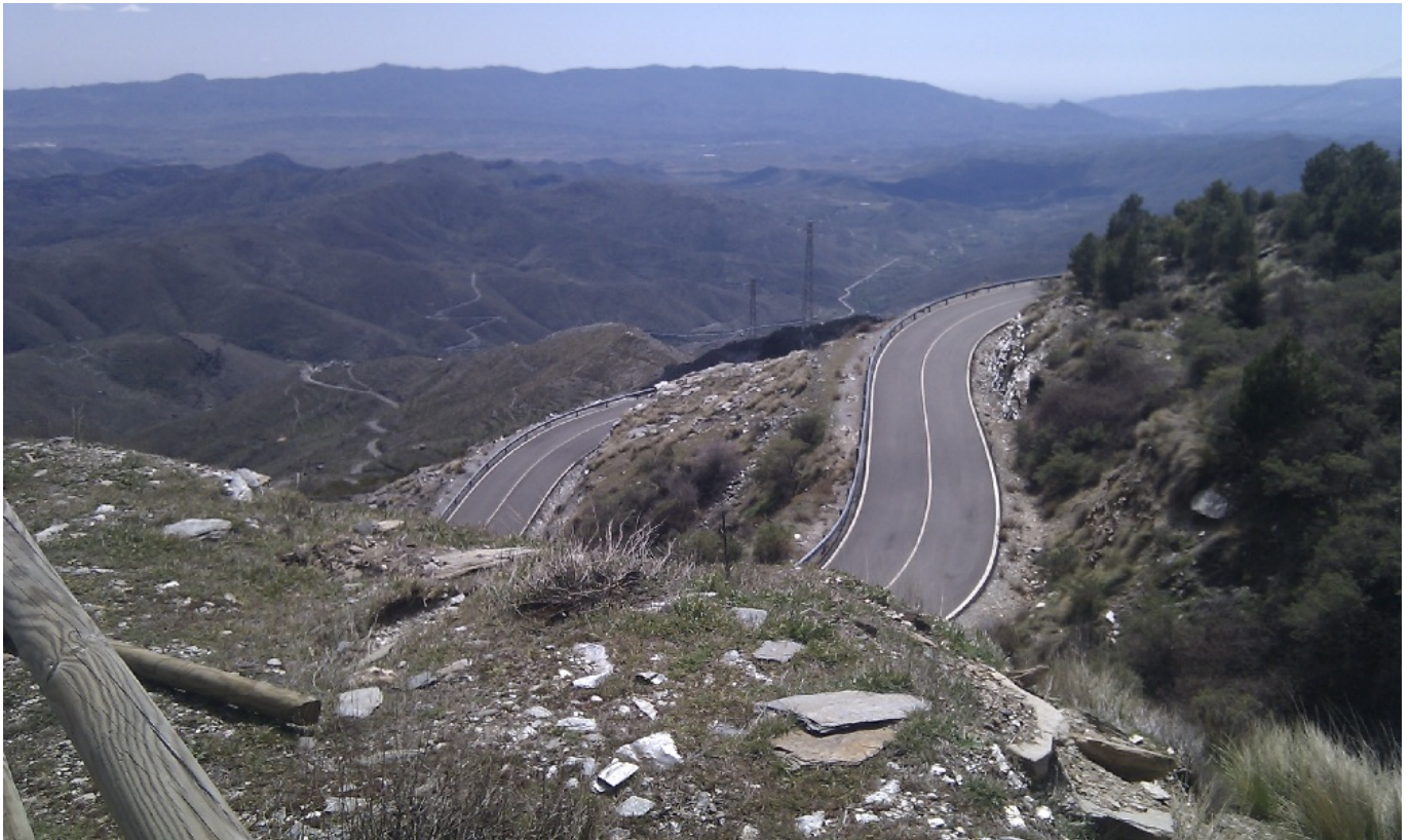
Blick zurück Richtung Velefique

Die Strecke liegt in Andalusien auf der Ostseite der Sierra Nevada. Die ersten 5 bis 6 km sind perfekt zum Einrollen. Dann kann man sich am südlichen Ortseingang von Velefique auf dem großen Tableau anschauen, was einen erwartet: Einstieg bei 860 m Höhe, die Fahrt geht zum Puerto de Velefique auf 1.820 m. Das heißt 14 km mit einer durchschnittlichen Steigung von 7,1%. Wobei das erste Drittel eher 9 - 10 % hat, die dann auf ca. 6 % zurück gehen. Anschließend geht es dann bergab nach Bacares auf ca. 1.200 m Höhe, bevor es dann in Richtung Calar Alto auf ganz knapp unter 2.000 m hoch geht. Und dann kommt das schönste Stück der Tour: Es geht ca. 20 km abwärts bis auf ca. 700 m Höhe.