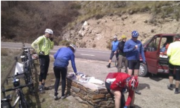
Rast und Kleiderpause

Eins vorab, der Straßenbelag war super, so gut wie neu und deshalb toll zu fahren. Die Steigung selbst fuhr sich für mich auch erstaunlich gut. Auf ca. 1.600 m Höhe gab es dann eine längere Pause mit leckerer Verpflegung. Der Tipp, schon hier etwas wärmere Kleidung anzulegen, war gut. Oben auf dem Sattel in 1.820 Höhe beim Warten auf den einen oder anderen Nachzügler hätten wir sonst bei erschreckend niedrigen 4 Grad doch heftig gefroren.