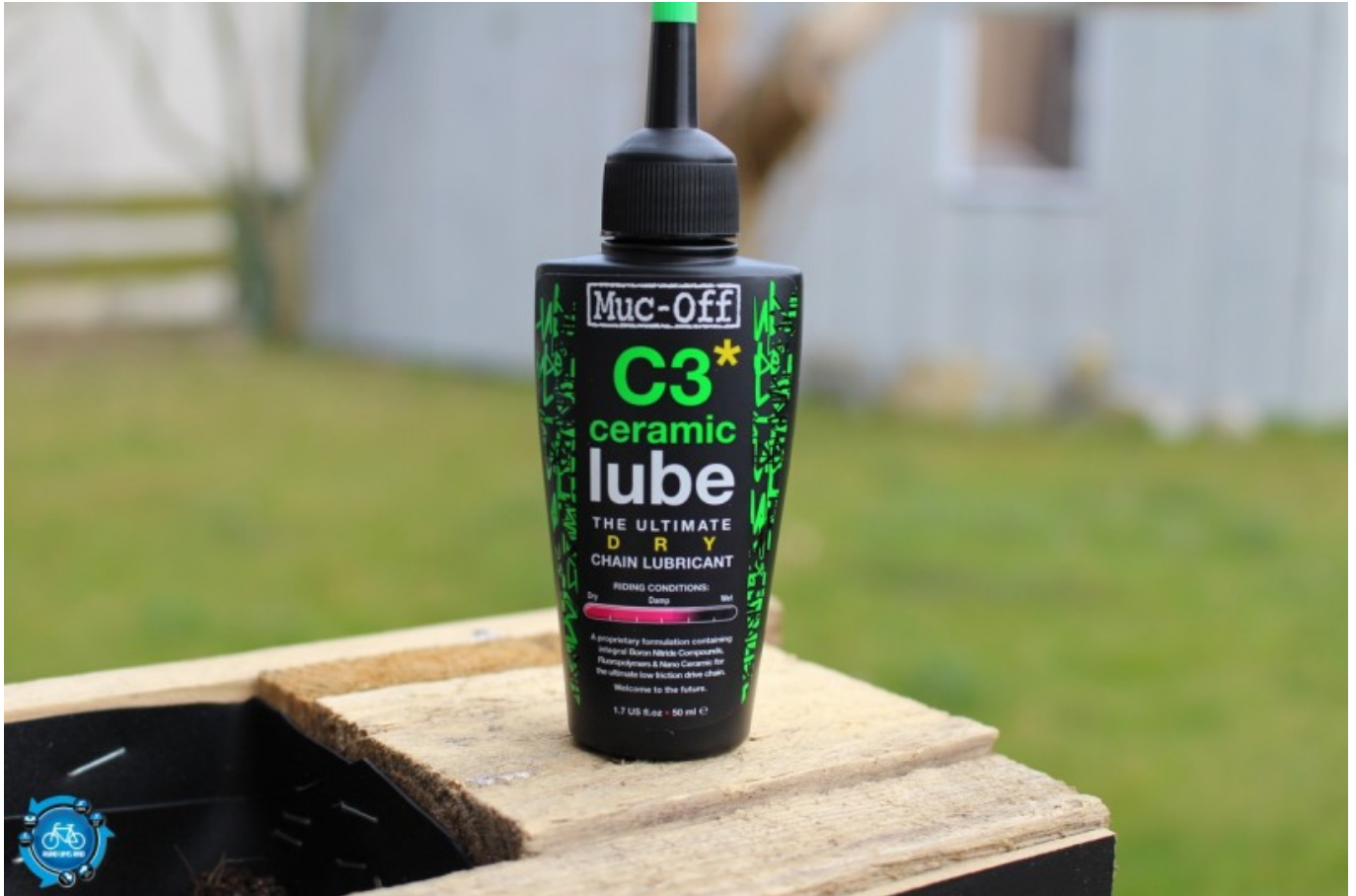
Muc Off C3 ceramic lube