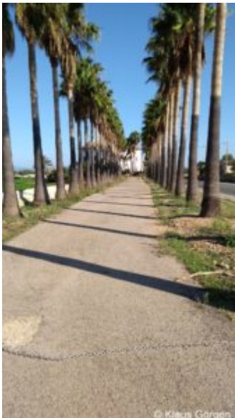
Mallorca im Herbst

Dutzende Rennräder tummeln sind im Herbst absolut leer. Teilen musste ich die Wirtschaftswege allenfalls mit landwirtschaftlichen Fahrzeugen oder Anwohnern, die zu ihrer Finca wollten.