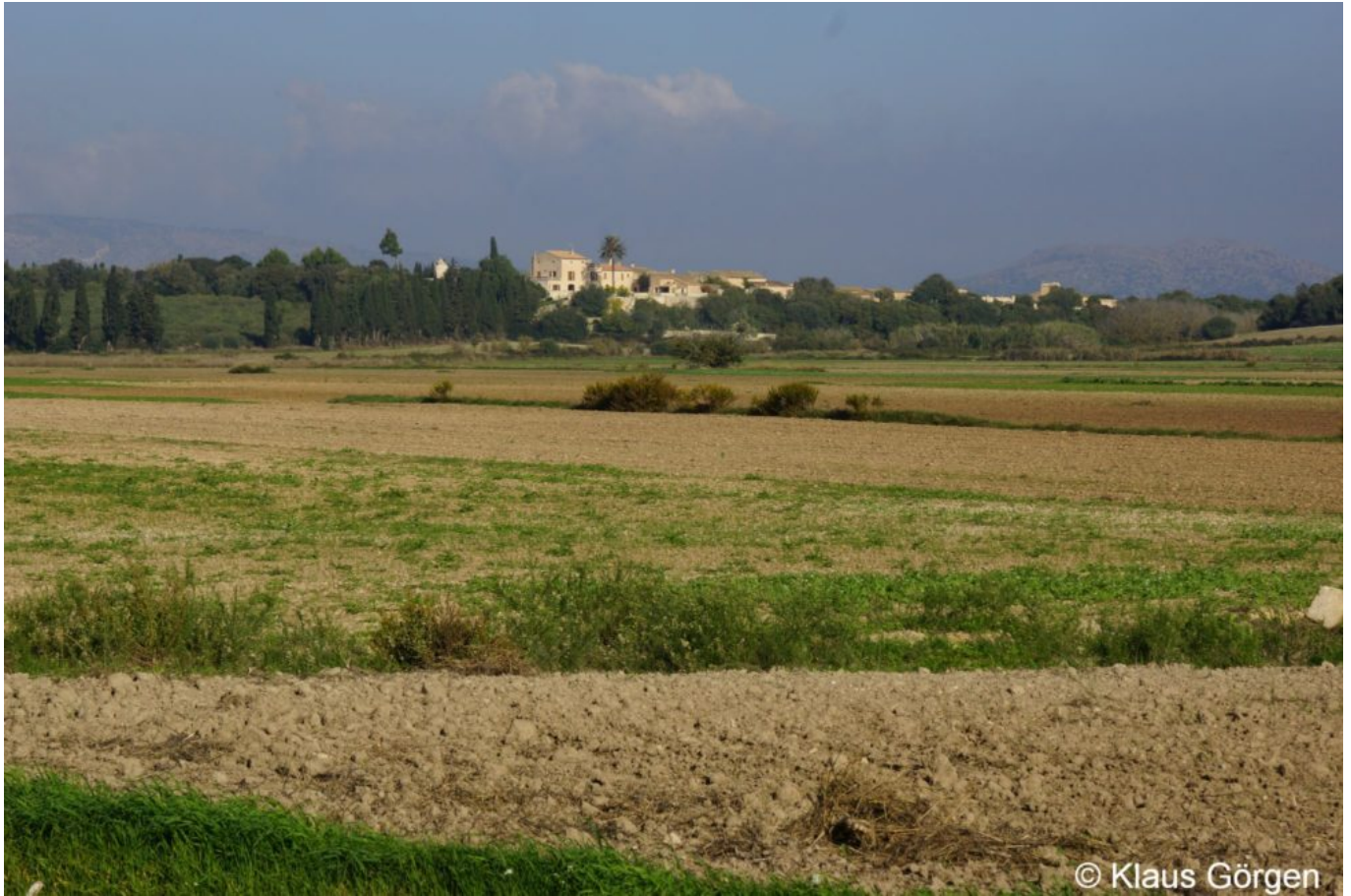
Mallorca im Herbst

Ich denke, ich werde noch öfter im Herbst zum Radeln in Malle sein. Das Risiko, dass meine Lieblingsstraßen überfüllt sind, scheint auf lange Zeit gering.