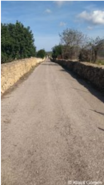
Mallorca im Herbst: Leere Nebenstrecken