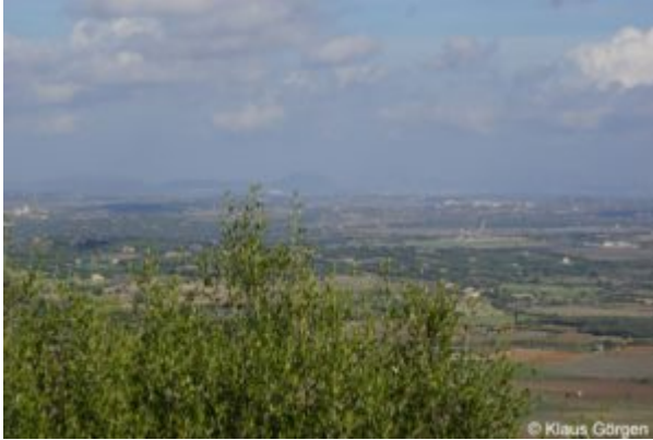
Mallorca im Herbst: Weiter Blick von Bonany

Dann geht's den teilweise recht steilen Anstieg zum Kloster Bonany oder korrekt zur Ermita de Bonany hoch. Der Anstieg beträgt rund 200 HM auf etwa 4 km mit einigen ordentlich steilen Stellen. Von oben hat man zur Belohnung einen weiten Ausblick über größere Teile der Insel, die man im Herbst ungestört genießen kann.