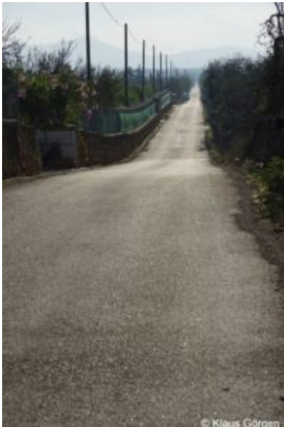
Mallorca im Herbst: ganz allein

Zum zweiten Mal war ich dieses Jahr Ende Oktober zum Rennrad Fahren auf Mallorca. Schon letztes Jahr war