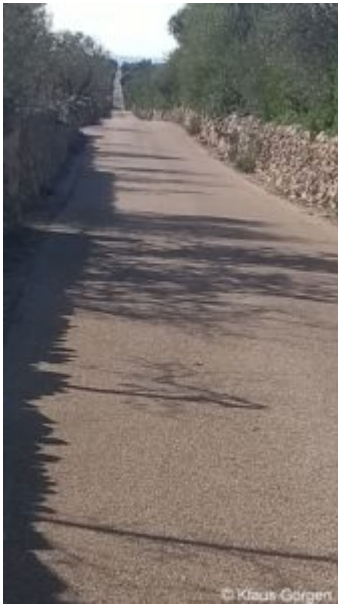
Mallorca im Herbst: Keine Radler

klar, dass wir wieder kommen würden. Im Vergleich zum Frühjahr ist die Insel so leer, dass man sich gelegentlich einsam fühlen kann. Kilometerlange Nebenstraßen, auf denen sich im März