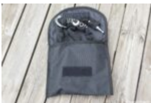
Kette mit Oberrohr-Tasche