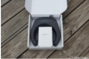
I LOCK IT Pro

Haveltec hat uns neben dem neuen I LOCK IT Pro auch eine Kette mit Tasche, die Adapter, sowie einen Handsender geschickt. Wir sind also jetzt voll ausgerüstet.