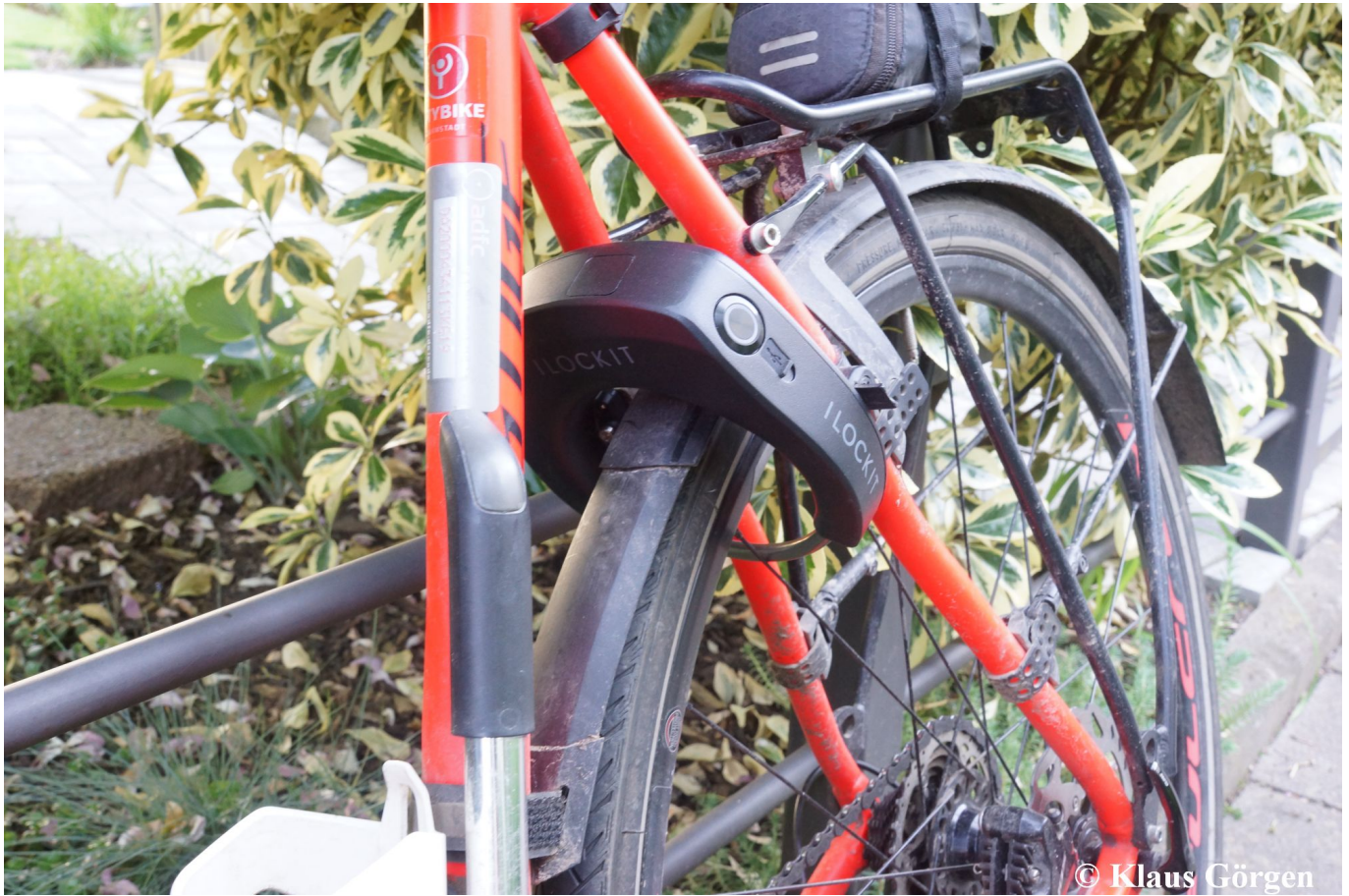
I LOCK IT Pro am Rad

Rund fünf Jahre nach dem ersten I LOCK IT Test haben wir das neue I LOCK IT PRO von der haveltec GmbH ans Rad montiert und ergiebig getestet. Hier unser Bericht.