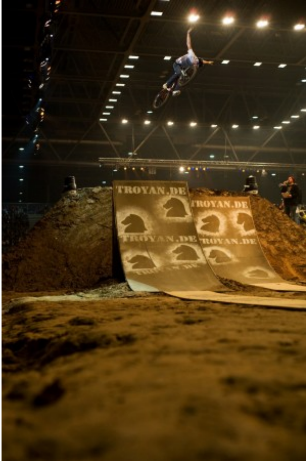
Spot: Leipzig