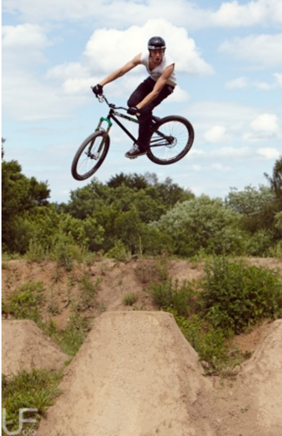
Fotograf: Urs Kusche | BikeBase Merkenbach