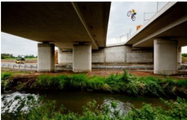
Spot: Duisburg

Was mir beim Radfahren allerdings mehr gefällt ist die Möglichkeit kreativ zu werden, sich neue Tricks und Lines einfallen zu lassen oder andere Locations zu fahren und vor allem miteinander statt gegeneinander seine Runden zu drehen.