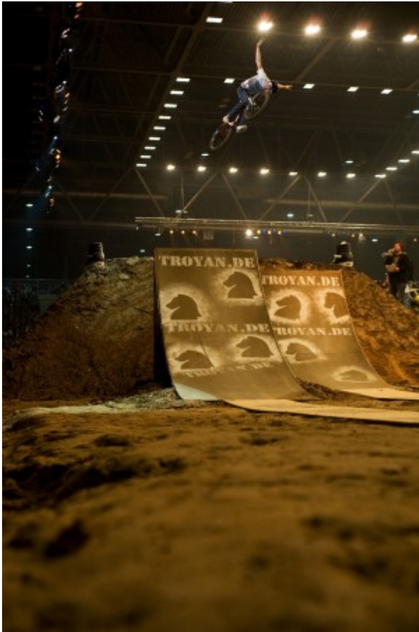
Spot: Leipzig