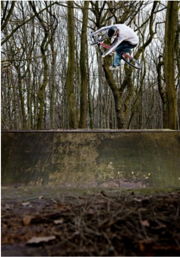
Spot: Witten

paar mal wieder gemacht und laufen klappt auch hervorragend.