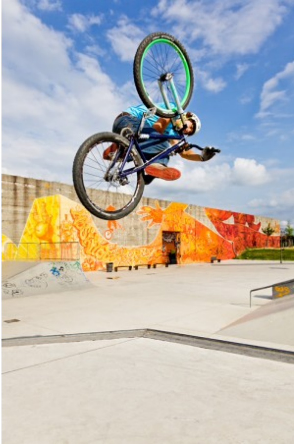
Spot: Duisburg