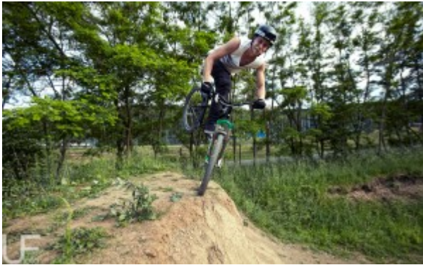
Spot: BikeBase Merkenbach

Im Moment kann ich mir mein Leben nicht schöner vorstellen. Ich habe alles selbst in der Hand und mach genau die Dinge die mir Spaß machen. Was will man mehr?