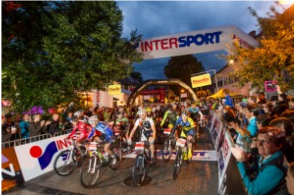
Start der Extremstrecke

Pünktlich um 5:00 Uhr starteten bereits die ersten 628 vergnügungssüchtigen Sportler trotz Regen in die Monsterdistanz über 211 km und 7.049 hm durch die Welterbe-Region. Vormittags fiel der Startschuss für die kürzeren Distanzen. Die verschiedenen Rennen wurden trotz Regen größtenteils glimpflich beendet. Zielschluss war um 21 Uhr. Somit hatten die Fahrer der Extremstrecke 16 Stunden Zeit über die Berge zu kommen.