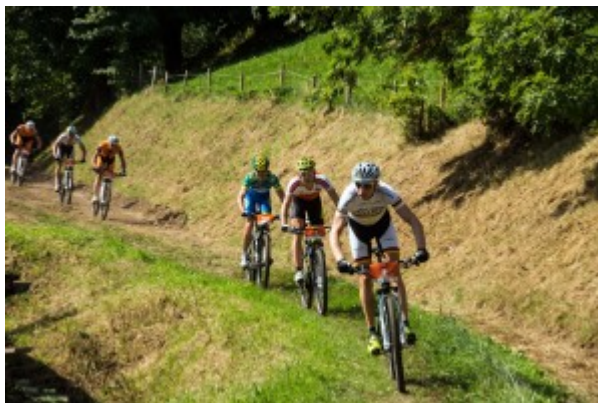
...über unzählige Trails surfen