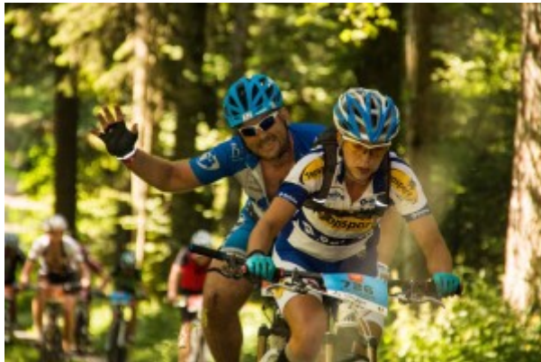
...aber bitte auch mal mit einem Lächeln