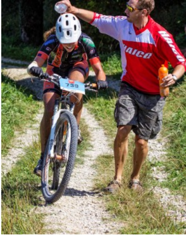
...kämpfen bis zum bitteren Ende