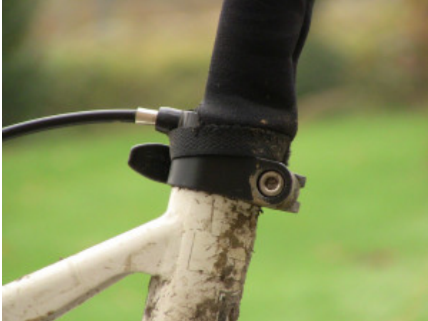
Zugaufnahme unten an der Hülse

Nebenbei sind sie sehr bequem, weil man sich das absteigen/aufsteigen, ständig neu fetten (oder eben Rahmen ausreiben bei Unterlassung) und die Fummelei mit verdreckten Schnellspannern usw. spart. Soweit toll, wären da nicht die Nachteile wie etwa Optik (?), Handhabung der Stützen (Rockshox Reverb z.B. hat eine unkluge Zugführung, die sich mit der Stütze mitbewegt, da schleift es öfter mal oder es hängt etwas im Weg) das höhere Gewicht und der hohe Preis.