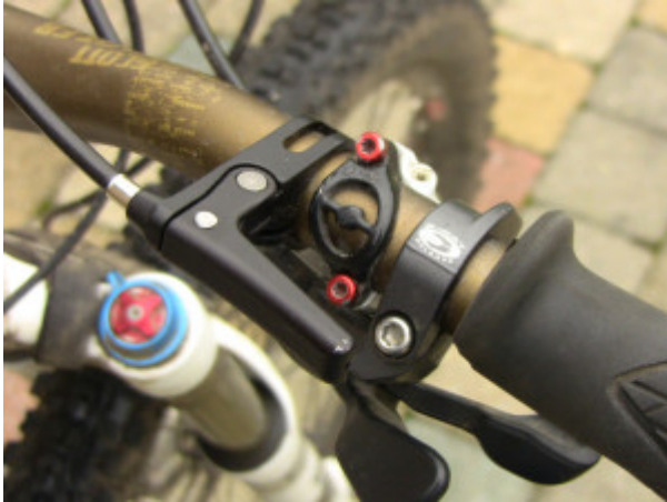
Hebel am Lenker (lang)

Knirschen oder klemmen ist bei meinem Exemplar nicht vorgekommen.