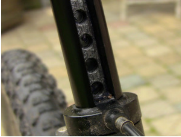
Rasterung ohne den Neoprenschutz

Allerdings bedeutet das nicht, dass es nicht auch so halten kann.